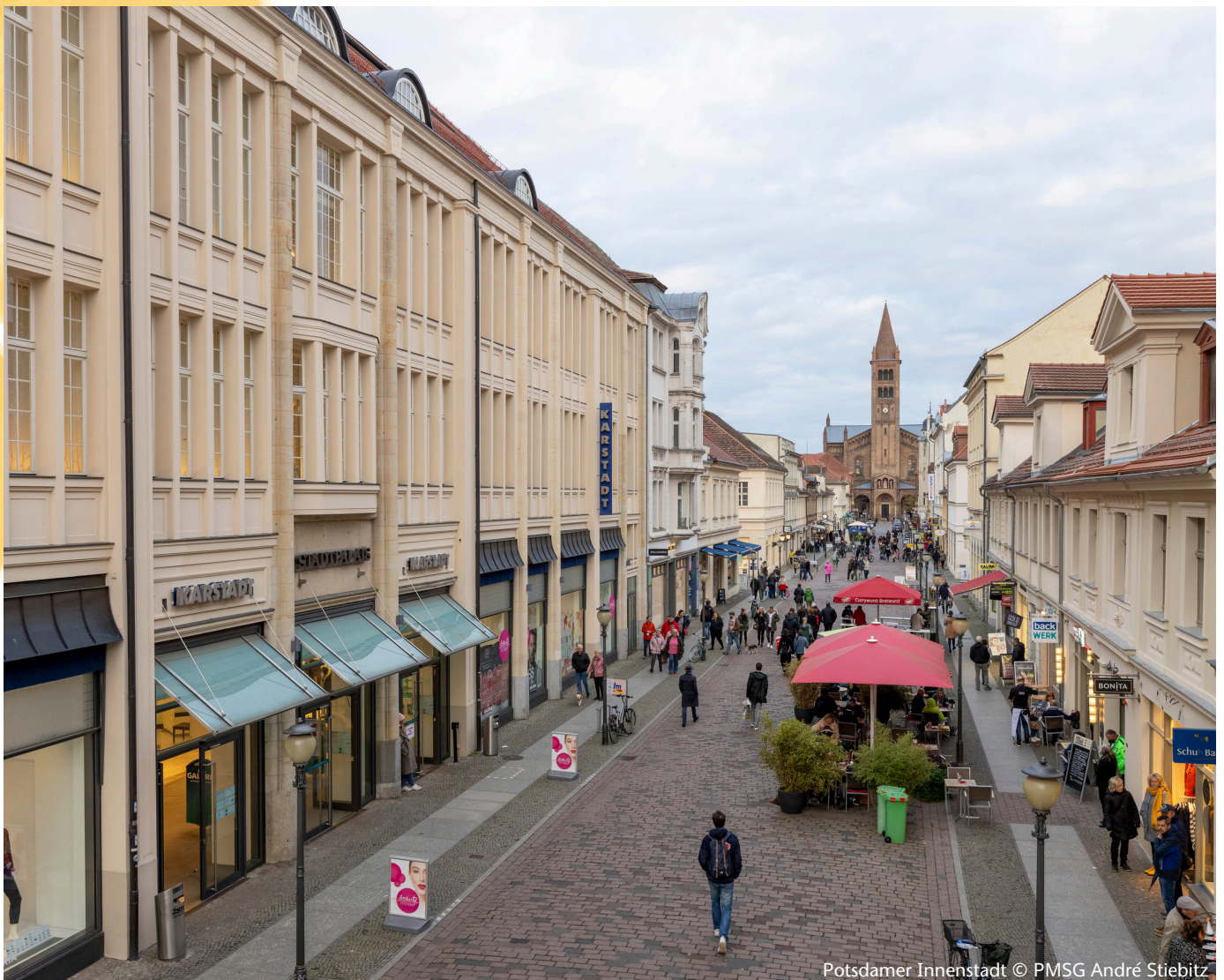
Potsdamer Innenstadt

(Hinweis: Nur eine Auswahl, ohne Wertung, ohne Gewähr auf Vollständigkeit, Änderungen vorbehalten)