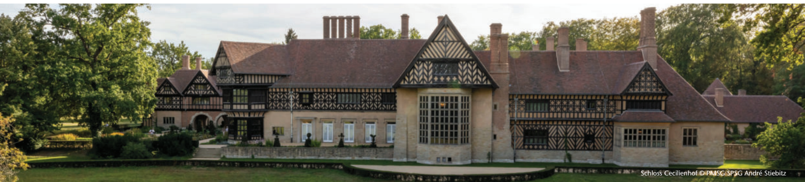
Schloss Cecilienhof

Für eine bessere Lesbarkeit gelten in diesen Angeboten die grammatikalisch maskulinen Personenbezeichnungen gleichermaßen für Personen jedes Geschlechts.