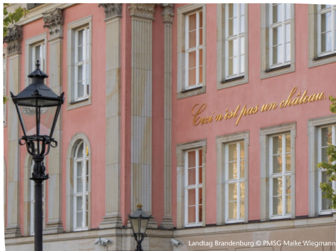
Landtag Brandenburg

Weitere Informationen und Anmeldung unter https://www.landtag.brandenburg.de/de/landtag_kennenlernen/besucherdienst/angebote_fuer_besucherguppen/25832