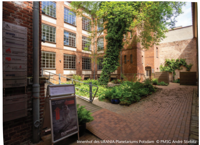
Innenhof des URANIA-Planetariums Potsdam

Weitere Informationen unter https://www.spsg.de/schloesser-gaerten/angebote-fuer-gaeste-mit-handicap/