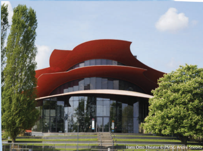
Hans Otto Theater

Weitere Informationen und Anmeldung unter https://www.hansottotheater.de/service/theaterinklusive-angebote/