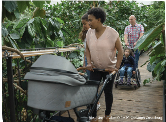
Biosphäre Potsdam

Weitere Informationen und Anmeldung unter https://www.biosphaere-potsdam.de/buchbare-angebote/gruppenreisen/programme/