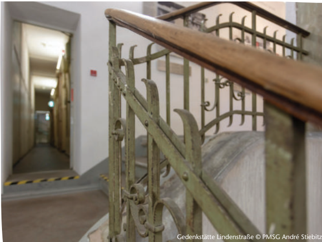
Gedenkstätte Lindenstraße