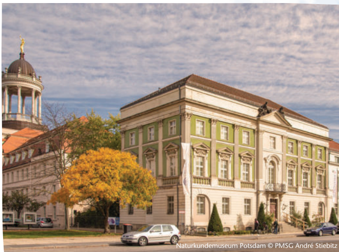
Naturkundemuseum Potsdam