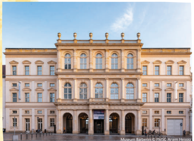
Museum Barberini

Weitere Informationen unter https://www.gedenkstaette-lindenstrasse.de/inklusive-angebote/